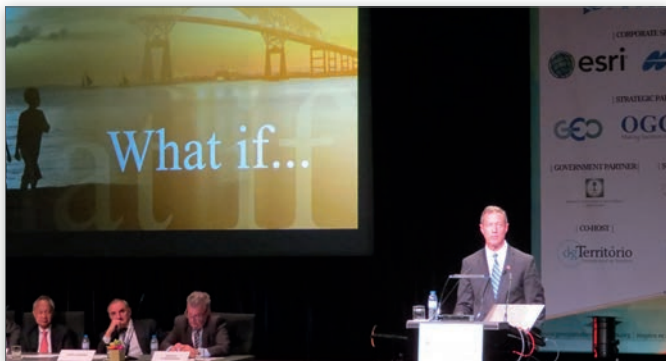
Martin O'Malley, Bewerber für die Präsidentschaftskandidatur der Demokraten in den USA, bei der Eröffnungsrede am Montag, 25.5.2015. Er verdeutlichte, dass man mit aktuellen Daten und thematischen Karten die Politik erfolgreich gestalten kann.

In einer beeindruckenden Rede zeigte er den Delegierten