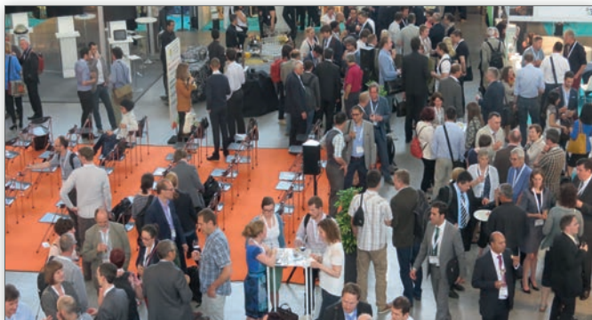
Ausstellungs- und Kommunikationsbereich der diesjährigen INSPIRE-Konferenz in Lissabon vom 25.-29.5.2015

Die diesjährige Konferenz fand vom 25. bis 29. Mai 2015 in Lissabon statt, zum ersten Mal im globalen Maßstab als gemeinsame Veranstaltung mit dem „Geospatial World Forum“, einer ebenfalls jährlich stattfindenden mehrtägigen Diskussionsplattform der Geoinformationsindustrie. Insgesamt nahmen mehr als 1700 Delegierte und Veranstalter bzw. Aussteller aus mehr als 100 Staaten an der Konferenz teil.