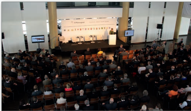
Eröffnung durch Heike Raab (Staatssekretärin im Ministerium des Innern, für Sport und Infrastruktur Rheinland-Pfalz und Beauftragte der Landesregierung Rheinland-Pfalz für IT)

Mit 36 Vorträgen, 6 Workshops und 28 Ausstellungen bot der bisher größte Fachkongress ein prall gefülltes und vielfältiges Forum. Hier bestand eine exzellente Gelegenheit, die politischen und strategischen Themen des IT-Planungsrats in den Verwaltungen des Bundes, der Länder und der Kommunen zu diskutieren und Praxiserfahrungen auszutauschen.