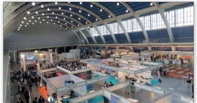
Ausstellungs- und Kommunikationsbereich der diesjährigen INSPIRE-Konferenz in Lissabon vom 25.-29.5.2015

Neben den großen Plenarsitzungen wurden viele Vortragsblöcke und Workshops rund um das Thema Geoinformationstechnologie und -infrastruktur angeboten. Neu und erfolgreich wurde außerdem ein großer Ausstellungsbereich mit Messecharakter in den Rahmen der Konferenz integriert.