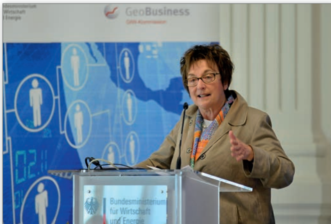
Brigitte Zypries, Parlamentarische Staatssekretärin beim Bundesminister für Wirtschaft und Energie, eröffnete den GeoBusinessCONGRESS; © Jürgen Gebhardt/GIW-Kommission

Brigitte Zypries, Parlamentarische Staatssekretärin des Bundesministers eröffnete den Kongress mit einer Keynote zum Thema „ Die digitale Welt der Geodaten – wirtschaftliche Chancen erkennen und nutzen “.